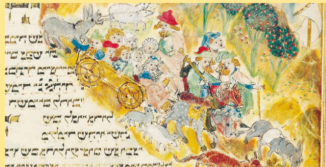
Flucht aus einer deutschen Stadt. Aus einem Gebetbuch von 1427.

18 - 20 Uhr Vortrag von Fritz Backhaus (Historiker, Deutsches Historisches Museum, Berlin)